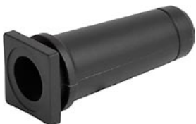
4311.0068 PVC Knickschutztüle für Kabelausendurchmesser 10mm, 3 x 14AWG