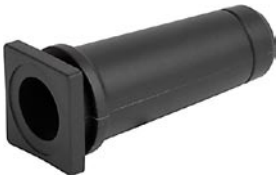
4311.9316 PVC Knickschutztülle für Kabelaussendurchmesser 8.7mm, 3 x 16AWG