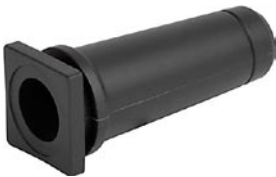
4311.9318 PVC Knickschutztülle für Kabelaussendurchmesser 10mm, 3 x 14AWG