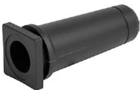
4311.0053 PVC Knickschutztüle für Kabelausendurchmesser 8.7mm, 3 x 16AWG