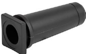
4311.9319 PVC Knickschutztülle für Kabelaussendurchmesser 10mm, 3 x 14AWG