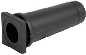
4311.9306 PVC Knickschutztülle für Kabelaussendurchmesser 8.7mm- 10mm, 3 x 14AWG