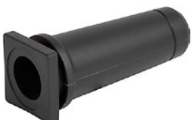
4311.9305 PVC Knickschutztüle für Kabelausendurchmesser 8.7mm- 10mm, 3 x 14AWG