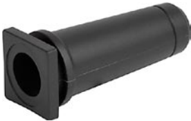
4311.9317 PVC Knickschutztülle für Kabelaussendurchmesser 8.7mm, 3 x 16AWG